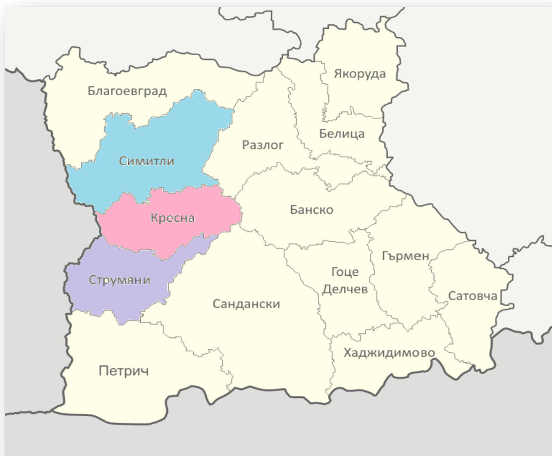
Фигура 1: Карта на МИГ „Струма“